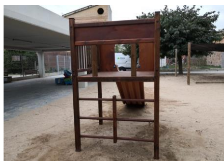
L'acabat de les imatges pot no coincidir amb la descripció dels materials.